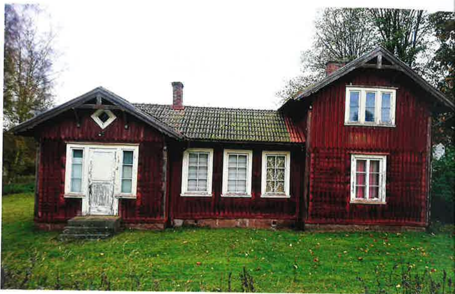
Torpåkra station, dit Hilja och Antti anlände, finns fortfarande kvar, och en renovering av det faluröda huset har påbörjats.