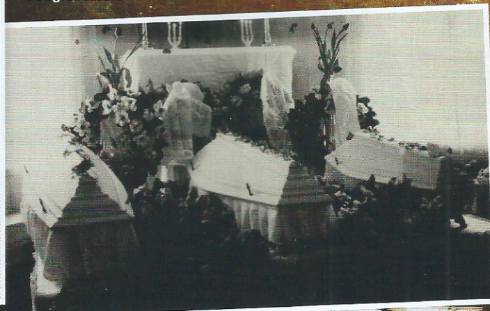
TRAGEDI: Tre små kister i begravelsen.