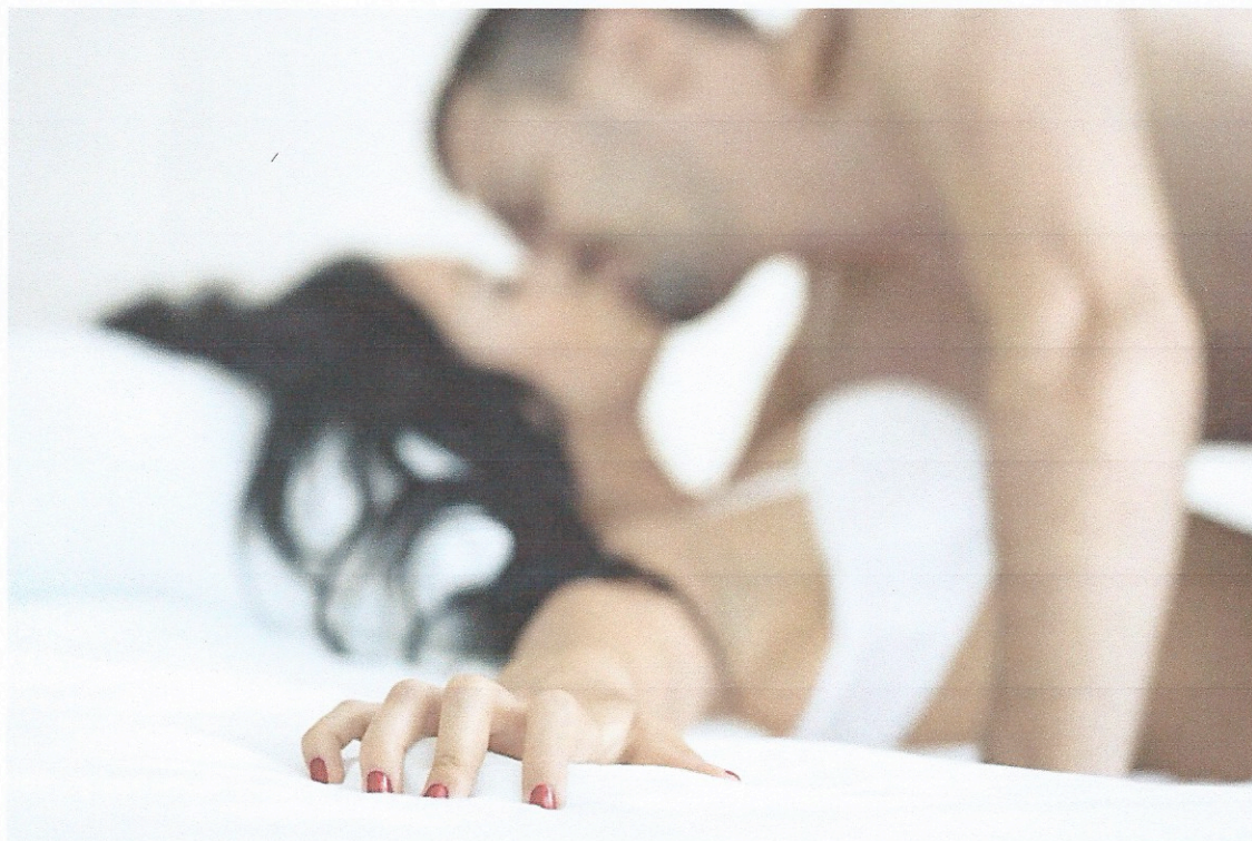
Erotik är en genre som blivit stor i prenumerationstjänsterna.